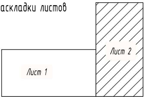
Схема раскладки листов